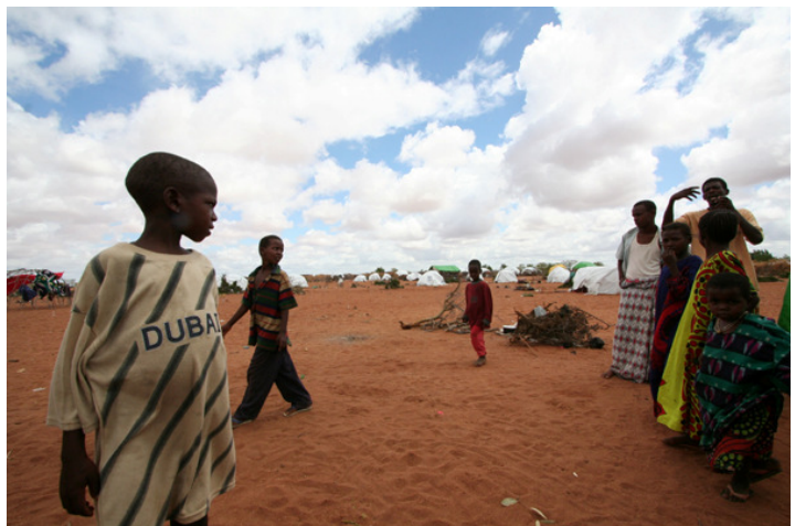
10 milioni di kenyan hanno urgente bisogno di cibo.

Il vice ministro della sicurezza interna, Orwa Ojode, ha detto: «Siamo consapevoli del problema. Ma abbiamo dato ordine alla polizia di arrestare immediatamente coloro che sono dietro questo commercio di armi illegali». Vista la velocità con cui si varano riforme, quell'"immediatamente" fa sorridere. E se "dietro" questo commercio ci fossero personalità politiche? Vista la facilità con cui si è evitata l'incriminazione per le violenze d'inizio 2008, perché non ripeterle, e in modo più sistematico, nel 2012?